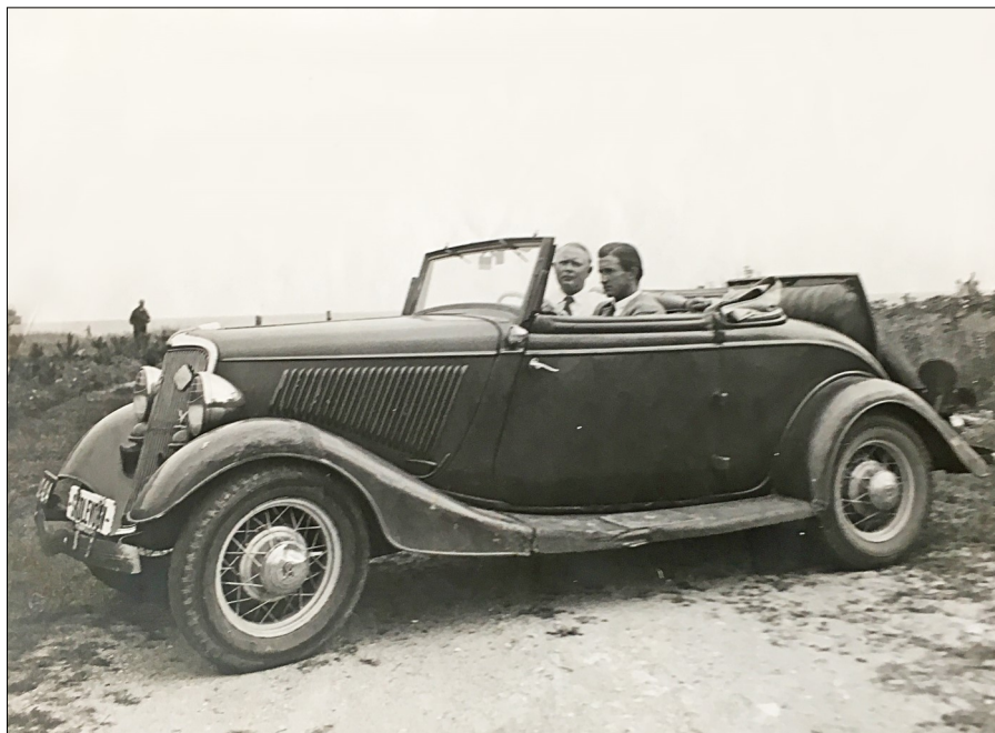
Min fars første skolevogn

Jeg erindrer også meget tydeligt, at jeg fik lov til at sidde på en sten lige ved portindgangen, hvorfra jeg kunne følge med i gaden liv. Det sjoveste var naturligvis, hvis min far kørte forbi med en af sine elever, og jeg kunne vinke.