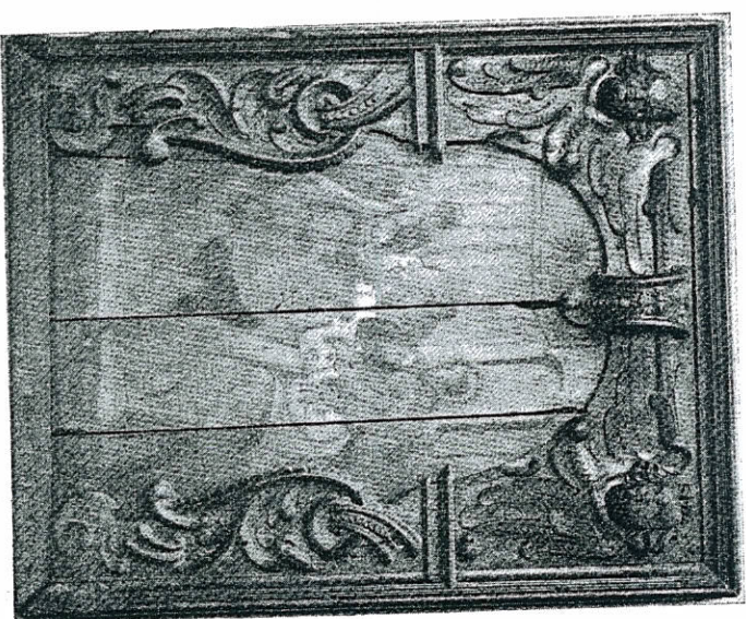
Midtfeltet af S. Ibs altertavle.