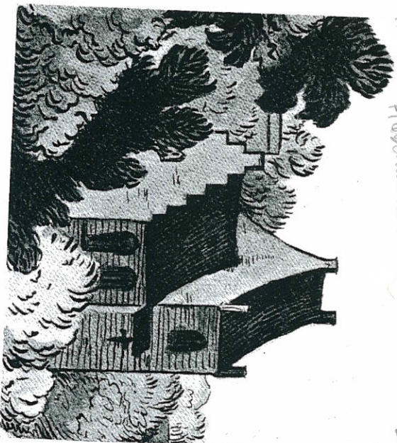
S. Ibs kirke c. 1600. Efter Münchenertegningen.

Aar bøger udgivet af Høstprisen Samfund Høstprisen's Amd. 1923 S. 52-81