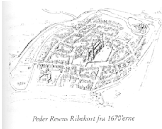
Peder Resens Ribekort fra 1670'erne