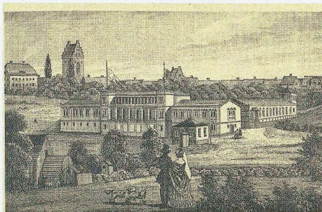
Maglekilde Vandkur Anstalt ved Roskilde 1847.

Samtidigt kobberstik af Vandkuranstalten ved Maglekilde.