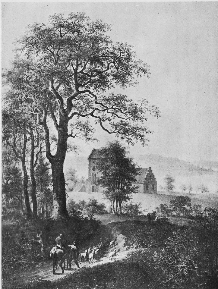
Sct. Ibs Kirke. Maleri af S. Mygind 1812.

I Auktionskonditionerne i 1815 var der med Hensyn til Kirkegaarden taget det Forbehold, at den ikke maatte afbenyttes til Bygning, Pløjning eller Saaning før Udgangen af 1828. Da den foreskrevne Frist var udløbet, blev den i en Del Aar anvendt til Agerland. Da skulde man tro, at den gamle Kirkegrunds Saga som indviet Jord for evigt var omme. Men saaledes gik det ikke. Kirkegaarden har oprindelig kun været lille. Mod Nord strakte den sig kun til