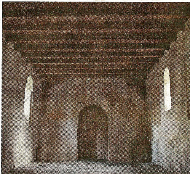
Det gamle kirkerum/pakhus, som det ser ud i dag.

Bevæger man sig ud af Roskilde mod nord af Frederiksborgvej, ser man det, der nu er tilbage af Sankt Ibs Kirke. Kirken blev opført omkring år 1100 og er som andre lokale kirker fra den tid opført i frådsten. Kom man fra nord til Roskilde, var det den første kirke, som man mødte. Den var mere end sognekirke for Sankt Ibs sogn, den var også en pilgrimskirke. Den er opkaldt efter apostlen Jakob, der ifølge traditionen er begravet i Santiago de Compostela i Spanien. Den dag i dag er denne spanske by målet for mange pilgrim-