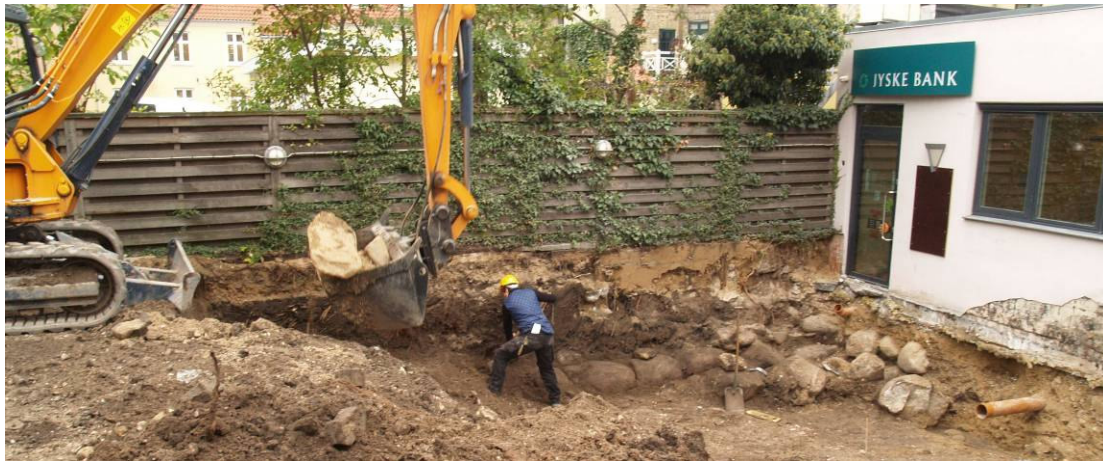
De øverste jordlag blev gravet væk med maskinkraft. Kampestenene i hjørnet er en del af fundamentet til kirketårnets vestvæg, hvis nøjagtige placering hidtil har været ukendt.

Jyske Bank A/S henvendte sig i april 2006 til Kulturarvsstyrelsen med ønsket om at udvide sin filial i Algade 24, Roskilde, mod syd, netop hvor den fredede ruin af Skt. Mikkels kirke og kirkegård ligger. Kulturarvsstyrelsen var villig til at give bygherren dispensation fra fredningen, såfremt jordarbejdet blev planlagt og gennemført som en arkæologisk undersøgelse under ledelse af Roskilde Museum. Således foretog museet i efteråret 2006 og foråret 2007 en arkæologisk udgravning på stedet. Udgravningen skulle afklare, hvorledes byggeriet mest hensigtsmæssigt kunne placeres i forhold til det fredede fortidsminde, samt sikre eventuelle dele heraf.