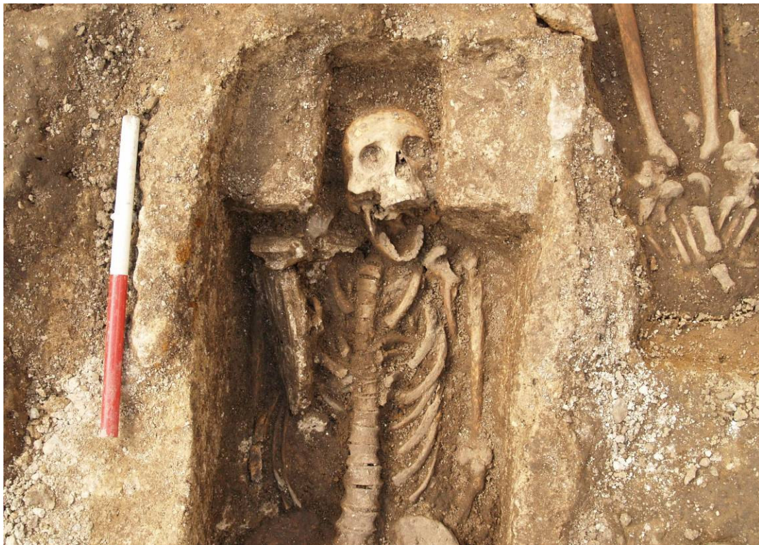
Grav A148. Kalkstenskiste med hovedrum.

Hvad angår 2006-udgravningen, var vejrliget temmelig ugunstigt. Der blev budt på en del regn og sne i perioder, hvilket blandt andet resulterede i, at udgravningsfeltet ved en enkelt lejlighed måtte pumpes tørt for vand. Enkelte dage måtte det udendørs arbejde helt indstilles på grund af kraftige snebyger. Disse ophold i udgravningsarbejdet anvendtes til gennemgang af fund og lister. 2007-udgravningen var derimod begunstiget med et smukt forårsvejr.