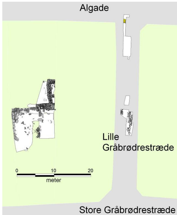
Kort med markering af sporene efter Skt. Mikkel's Kirke, blotlagt ved udgravningerne i 1980, 1994-95 og 2006-07. – Tegning: Roskilde Museum.

og blev taget op for eventuelt at kunne opstilles i udstillingssammenhæng. En anden – den intakte frådstenskiste A201 – blev kun delvist blotlagt ved udgravningen og strakte sig ind under nabogrunden, Algade 26. Det blev derfor besluttet at bevare den in situ under det kommende byggeri, hvor den, sammen med de øvrige ruindele fra selve kirken, er dækket først af et beskyttende lag fibertext, dernæst grus.