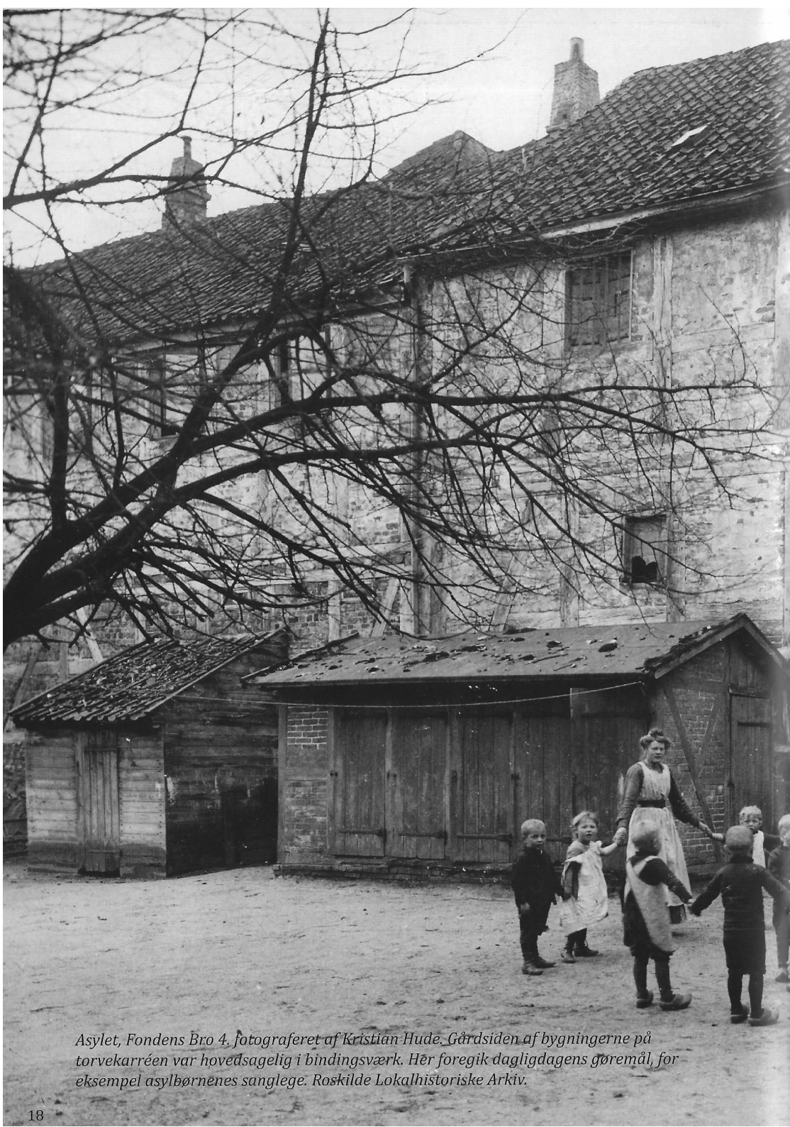
Asylet, Fondens Bro 4. Gårdsiden af bygningerne på torvekarréen var hovedsagelig i bindingsværk. Her foregik dagligdagens gøremål, for eksempel asylobørnenes sanglege.