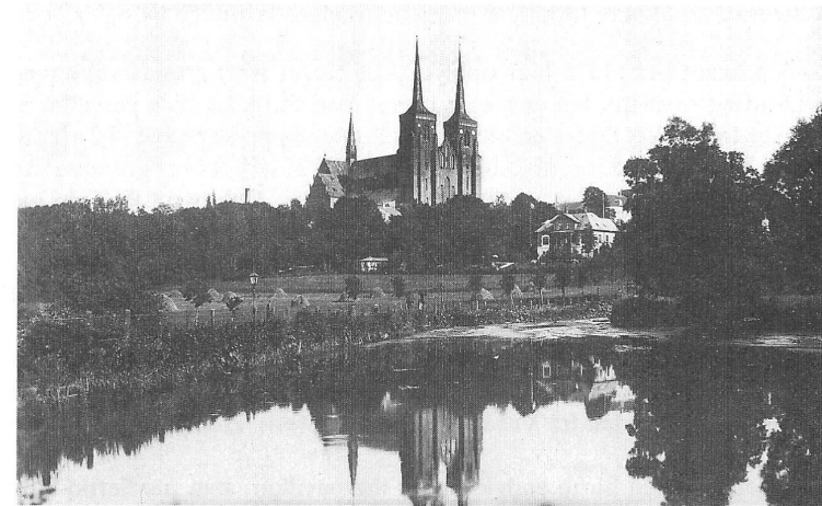
Ejendommen til højre i billedet er Roskildes første villa og området fra villaen og ned til Birkeallé kaldtes „Klokkervænget“. I midten af billedet ses ejendommens the-pavillon.

Huset havde de dejligste træudskæringer i gavlene, kvistvinduer med spir, knejsende træspir på taget, der vidnede om naboskabet til domkirken og frem for alt en hoveddør med finurlige smedejernsarbejder, som jeg nok gad røre og undersøge nærmere. Øverst på taget befandt sig en udsigtsterrasse. Senere har jeg fået at vide, at sådanne terrasser kendes